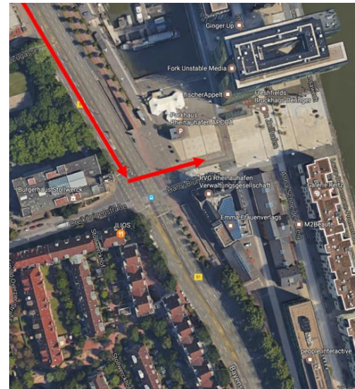
II. Einfahrt Harry-Blum-Platz

Bitte passieren Sie die Schranke und fahren parallel zum Rheinufer, bis Sie das Deutsche Sport & Olympia Museum erreichen.